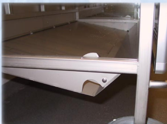
Oplukkeligt spjæld for nem rengøring