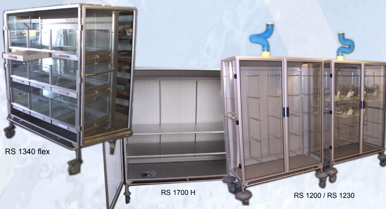
RS 1340 flex