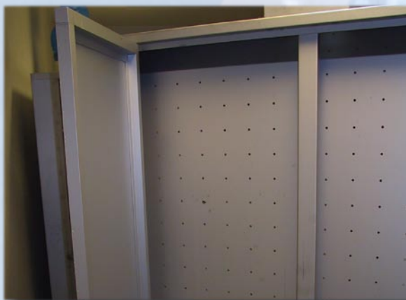
Adgang til ventilationskammeret