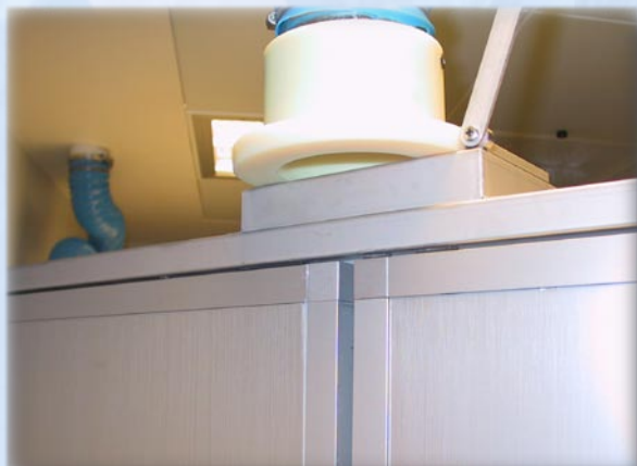
Hurtig tilslutning af ventilation